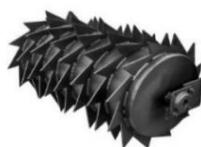
Packer fogazott henger